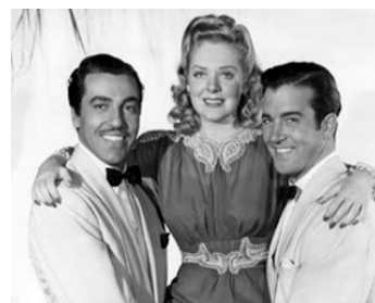
1941 WEEK-END À LA HAVANE (Weekend in Havana) de Walter Lang avec A. Faye, J. Payne