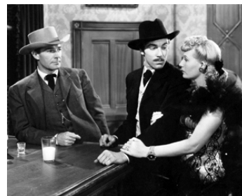
1939 L'AIGLE DES FRONTIÈRES (Frontier Marshal) d'Allan Dwan avec Randolph Scott, Nancy Kelly