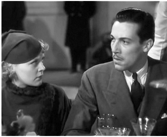
1934 L'INTROUVABLE (The Thin Man) de W. S. Van Dyke avec Ruth Channing