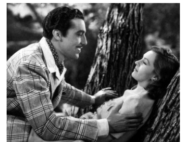
1940 IL ÉPOUSE SA FEMME (He married his Wife) de Roy Del Ruth avec Nancy Kelly