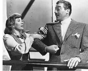
1948 LA BELLE IMPRUDENTE (Julia Misbehaves) de Jack Conway avec Greer Garson