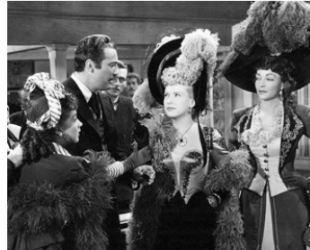
1949 MAM'ZELLE MITRAILLETTE (The Blonde of Bashful Bend) de P. Sturges avec B. Grable, M. Windsor