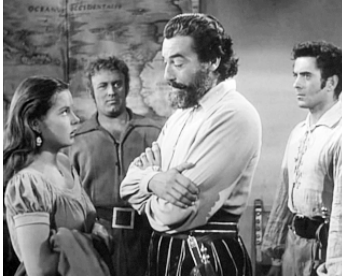
1947 CAPITAINE DE CASTILLE (Captain from Castile) d'H. King avec Jean Peters, Lee J. Cobb, T. Power