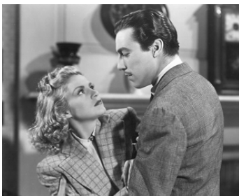
1938 FIVE OF A KIND d'Herbert I. Leeds avec Claire Trevor