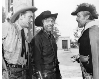
1954 VERA CRUZ (Vera Cruz) de Robert Aldrich avec Gary Cooper, Burt Lancaster