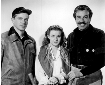
1948 L'ORPHELIN DE LA MER (Deep Waters) d'H. Hathaway avec D. Andrews, Jean Peters