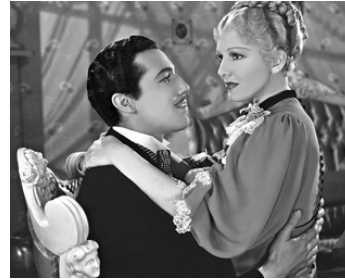
1935 DIAMOND JIM, MILLIARDAIRE (Diamond Jim) d'A. Edward Sutherland avec Jean Arthur