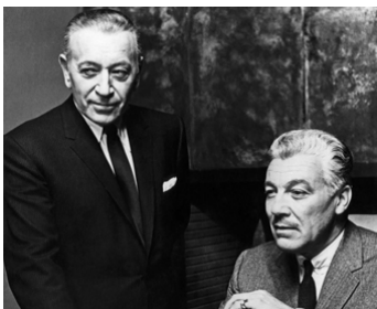
1960 L'INCONNU DE LAS VEGAS (Ocean's eleven) de Lewis Milestone avec George Raft