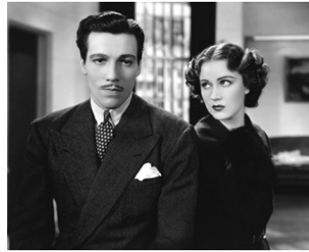
1934 AUDACES FÉMININES (Cheating Cheaters) de Richard Thorpe avec Fay Wray