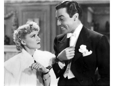
1936 L'AUDACIEUSE (Fifteen Maiden Lane) d'Allan Dwan avec Claire Trevor