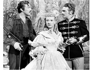
1948 LA DAME AU MANTEAU D'HERMINE (That Lady in Ermine) d'E. Lubitsch avec B. Grable, D. Fairbanks Jr