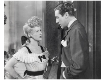
1943 L'ÎLE AUX PLAISIRS (Coney Island) de Walter Lang avec Betty Grable