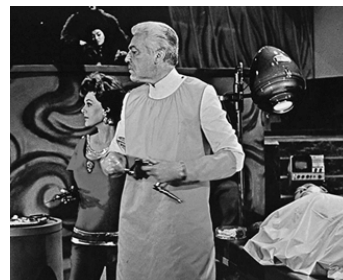
1969 LATITUDE ZÉRO (Ido zero daisakusen) d'Ishiro Honda avec Patricia Medina