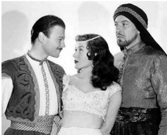
1953 PRISONNIERS DE LA CASBAH (Prisoners of the Casbah) de R. Bare avec Turhan Bey, G. Grahame