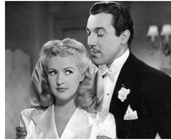
1942 IVRESSE DE PRINTEMPS (Springtime in the Rockies) d'Irving Cummings avec Betty Grable