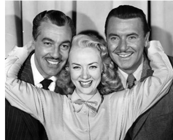
1951 LES FILLES DU SERVICE SECRET (FBI Girl) de W. Berke avec Audrey Totter, George Brent