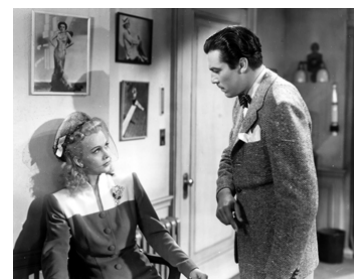
1941 DANCE HALL (Dance Hall) d'Irving Pichel avec Carole Landis