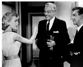
1962 UN MARI EN LAISSE (If a Man answers) d'Henry Levin avec Sandra Dee, Bobby Darin