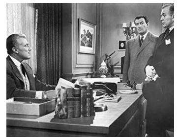
1964 LA MAISON DE MME ADLER (A House is not a home) de Russell Rouse avec Robert Taylor