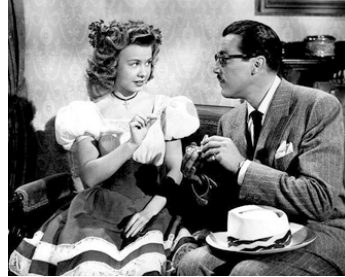
1947 CARNAVAL AU COSTA-RICA (Carnival in Costa-Rica) de Gregory Ratoff avec Vera-Ellen