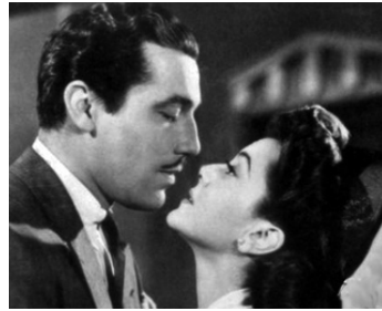
1942 KALAMAZOO (Orchestra Wives) d' Archie Mayo avec Ann Rutherford