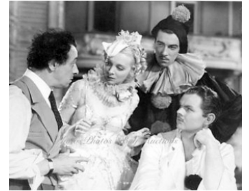
1935 LE ROMAN D'UN CHANTEUR (Metropolitan) de R. Boleslawski avec V. Bruce, Lawrence Tibbett