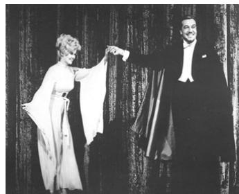
1964 UNE GUILLOTINE POUR DEUX (Two on a Guillotine) de W. Conrad avec Connie Stevens