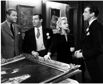
1941 SON DERNIER PARI (A Gentleman at Heart) de Ray McCarey avec M. Berle, Carole Landis