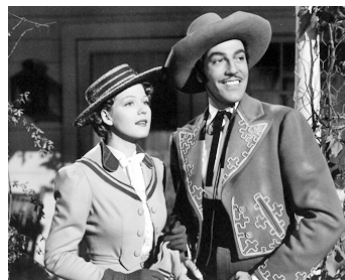
1939 LE RETOUR DE CISCO KID (Return of the Cisco Kid) d'Herbert I. Leeds avec Jean Rogers