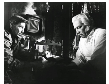
1974 LE SPECTRE D'EDGAR ALLAN POE (The Spectre of Poe) de M. Quandour avec Tom Drake