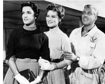
1955 LE CERCLE INFERNAL (The Racers) d'Henry Hathaway avec Katy Jurado, Bella Darvi