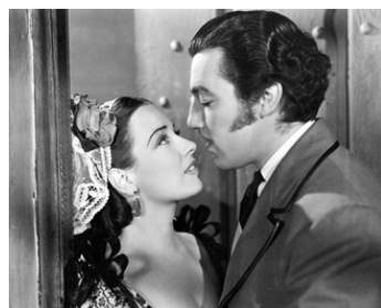
1940 ROSITA (Romance of the Rio Grande) d'Herbert I. Leeds avec Patricia Morison