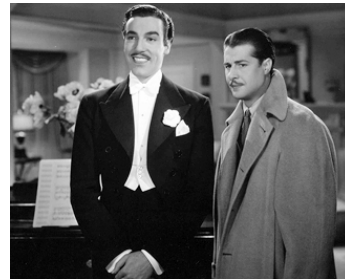
1937 L'ESCALE DU BONHEUR (Happy Landing) de Roy Del Ruth avec Don Ameche