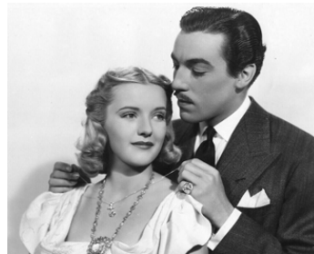
1937 DANGEROUSLY YOURS de Malcolm St Clair avec Phyllis Brooks