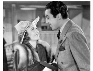
1938 ADIEU POUR TOUJOURS (Always goodbye) de Sidney Lanfield avec Barbara Stanwyck