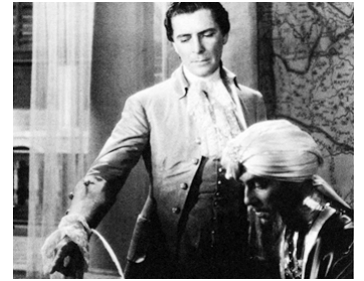
1934 RÉVOLTE AUX INDES (Clive on India) de Richard Boleslawski avec Ronald Colman