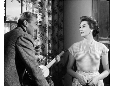
1953 LES FEMMES CONNAISSENT LA MUSIQUE (Street of Shadows) de R. Vernon avec K. Kendall