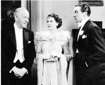
1935 CODE SECRET (Rendezvous) de William K. Howard avec H. Stephenson, Rosalind Russell