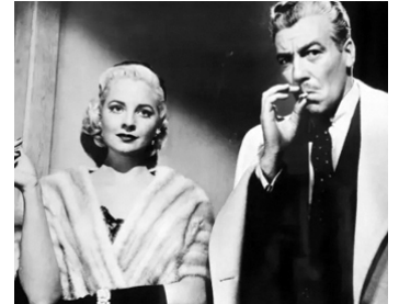
1956 L'ANGE DU RING (The Leather Saint) d'Alvin Ganzer avec Jody Lawrence