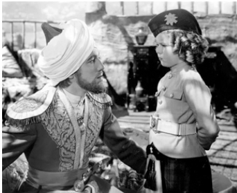
1937 LA MASCOTTE DU RÉGIMENT (We Willie Winkie) de John Ford avec Shirley Temple