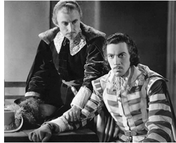
1935 RICHELIEU (Cardinal Richelieu) de Rowland V. Lee avec Douglas Dumbrille