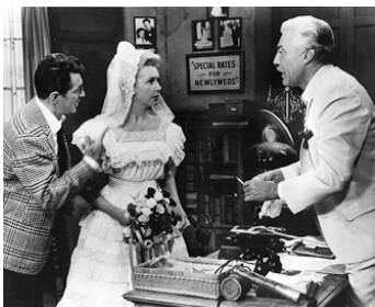
1964 LES INSÉPARABLES (Marriage on the rocks) de Jack Donahue avec Dean Martin, D. Kerr