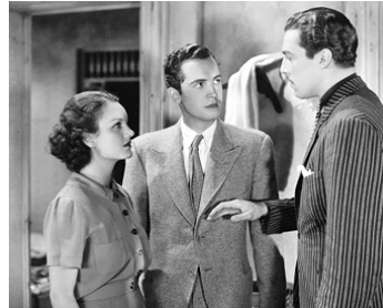
1935 SHOW THEM NO MERCY de George Marshall avec Rochelle Hudson, Edward Norris