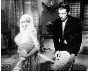
1935 LA FEMME ET LE PANTIN (The Devil is a Woman) de Josef von Sternberg avec M. Dietrich