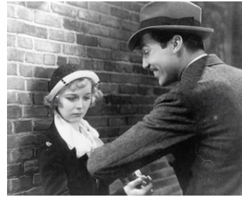
1934 LA BONNE FÉE (The Good Fairy) de William Wyler avec Margaret Sullavan