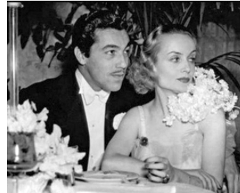
1936 CE QUE FEMME VEUT (Love before Breakfast) de Walter Lang avec Carole Lombard